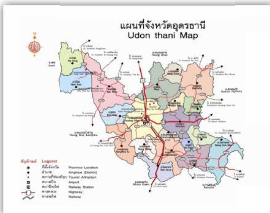
แผนภาพที่ 2 แผนที่จังหวัดอุดรธานี

จังหวัดอุดรธานีมีอาณาเขตติดกับจังหวัดอื่นๆ ดังนี้ ทิศเหนือติดกับจังหวัดหนองคาย (อำเภอท่าบ่อ อำเภอโพนพิสัย อำเภอศรีเชียงใหม่ และอำเภอสังคม) ทิศใต้ติดกับจังหวัดขอนแก่น (อำเภอน้ำพอง อำเภอภูเวียง) จังหวัดกาฬสินธุ์ (อำเภอสหัสขันธ์) ทิศตะวันออกติดกับจังหวัดสกลนคร (อำเภอวานรนิวาส อำเภอสว่างแดนดิน อำเภอวาริชภูมิ) ทิศตะวันตกติดกับจังหวัดหนองบัวลำภู (อำเภอเมืองหนองบัวลำภู)