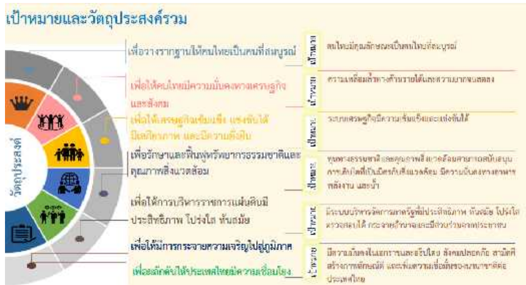
แผนภาพที่ 5 เป้าหมายและวัตถุประสงค์รวมของแผนพัฒนาเศรษฐกิจและสังคม ฉบับที่ 12