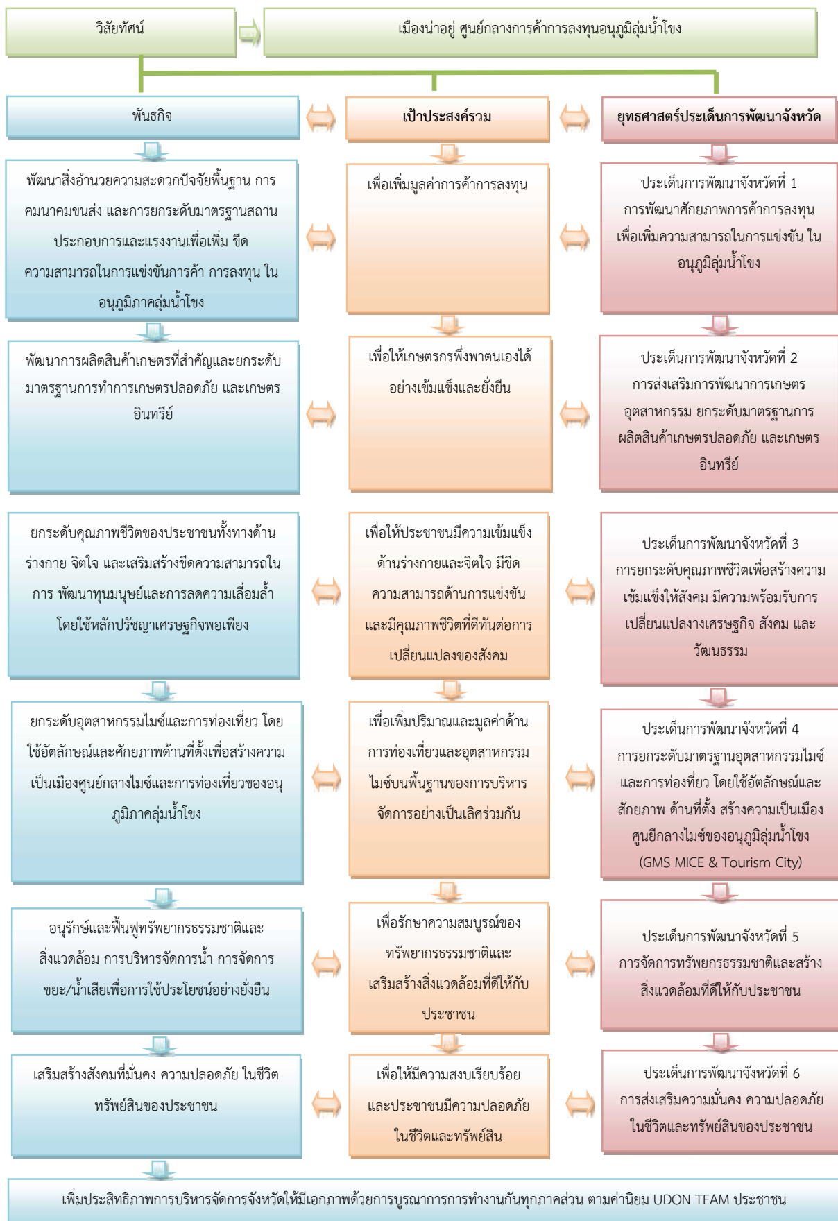
แผนภาพที่ 4 ความเชื่อมโยงของวิสัยทัศน์ พันธกิจ เป้าประสงค์รวม และประเด็นการพัฒนาจังหวัด