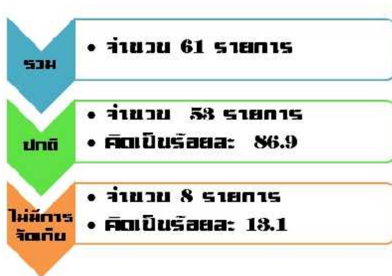
แผนภาพที่ 6 จำนวนและร้อยละของรายการสถิติ

ผังข้อมูลสถิติ มีรายการสถิติ ทั้งหมด 61 รายการ ซึ่งแบ่งสถานะรายการสถิติ ออกเป็น 2 ประเภท คือ รายการสถิติที่มีการจัดเก็บข้อมูลเป็นปกติ และรายการสถิติที่ยังไม่มีการจัดเก็บข้อมูล พบว่า รายการสถิติที่มีการจัดเก็บข้อมูลเป็นปกติ 53 รายการ คิดเป็นร้อยละ 86.9 และรายการสถิติที่ยังไม่มีการจัดเก็บข้อมูล 8 รายการ คิดเป็นร้อยละ 13.1