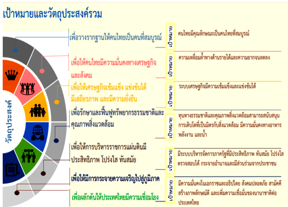
แผนภาพที่ 2 เป้าหมายและวัตถุประสงค์รวมของแผนพัฒนาเศรษฐกิจและสังคม ฉบับที่ 12