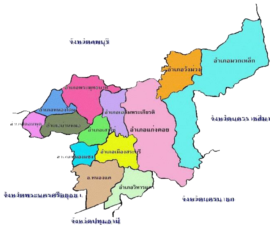
ตารางที่ 1. การแบ่งเขตการปกครอง เขตพื้นที่การปกครองในเขตเทศบาลและอำเภอปี พ.ศ. 2559