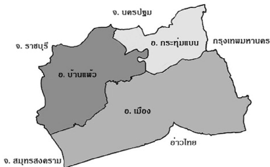
แผนภาพที่ 2.1 แสดงอาณาเขตจังหวัดสมุทรสาคร