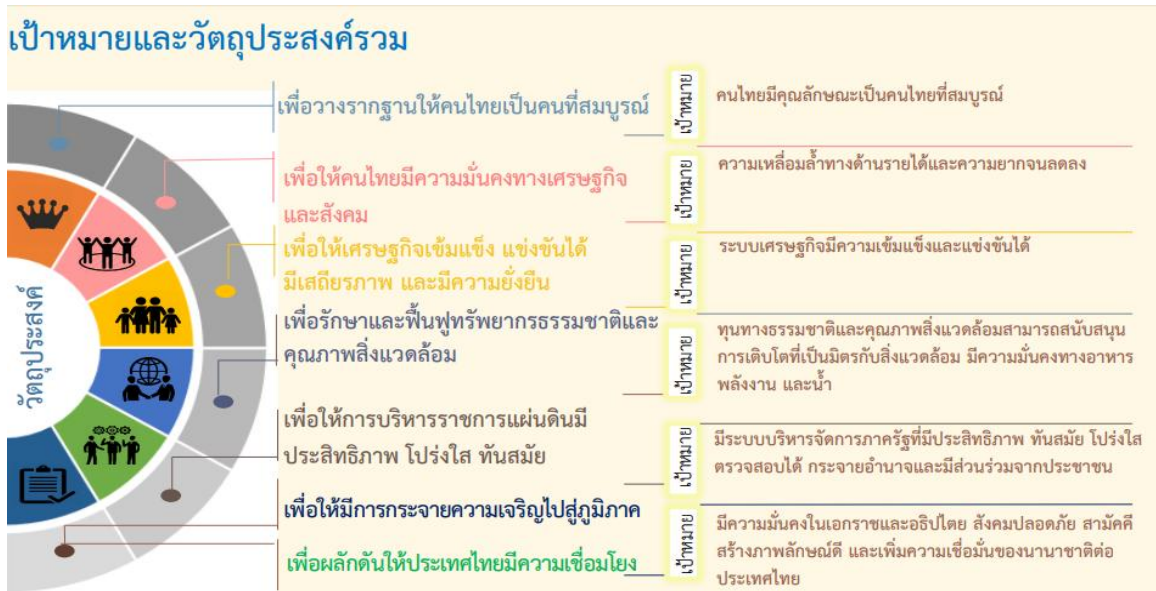
แผนภาพที่ 2.3 เป้าหมายและวัตถุประสงค์รวมของแผนพัฒนาเศรษฐกิจและสังคม ฉบับที่ 12

7. เพื่อผลักดันให้ประเทศไทยมีความเชื่อมโยง (Connectivity) กับประเทศต่างๆ ทั้งในระดับอนุภูมิภาค ภูมิภาค และนานาชาติได้อย่างสมบูรณ์และมีประสิทธิภาพ รวมทั้งให้ประเทศไทยมีบทบาทนำและสร้างสรรค์ในด้านการค้า การบริการ และการลงทุนภายใต้กรอบความร่วมมือต่างๆ ทั้งในระดับอนุภูมิภาค ภูมิภาค และโลก