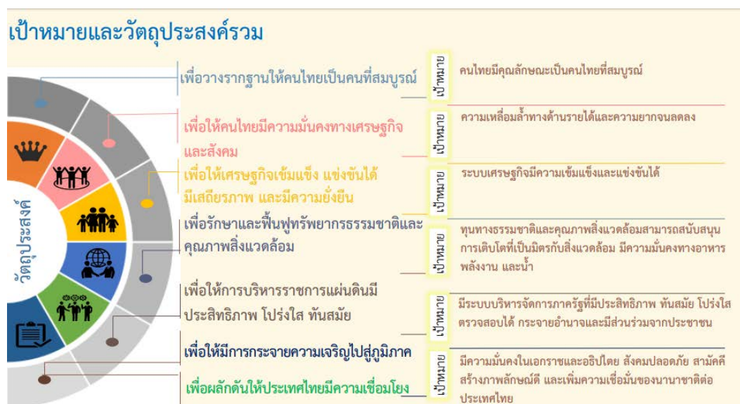
แผนภาพที่ 2 เป้าหมายและวัตถุประสงค์รวมของแผนพัฒนาเศรษฐกิจและสังคม ฉบับที่ 12