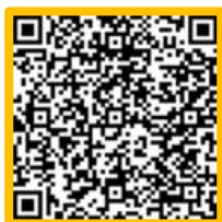
QR_code รายการข้อมูล “ผู้สูงอายุ”