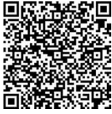
QR_Code ความหมาย Tier ๒

- Tier ๒ คือ สถิติทางการที่มีค่านิยามและวิธีการผลิต แต่ยังไม่มีข้อมูลพร้อมเผยแพร่ ซึ่งแบ่งออกเป็น ๗ ลักษณะและมีแนวทางการพัฒนาต่างกัน