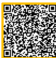
QR_code รายการข้อมูล “การบริหารจัดการขยะ”