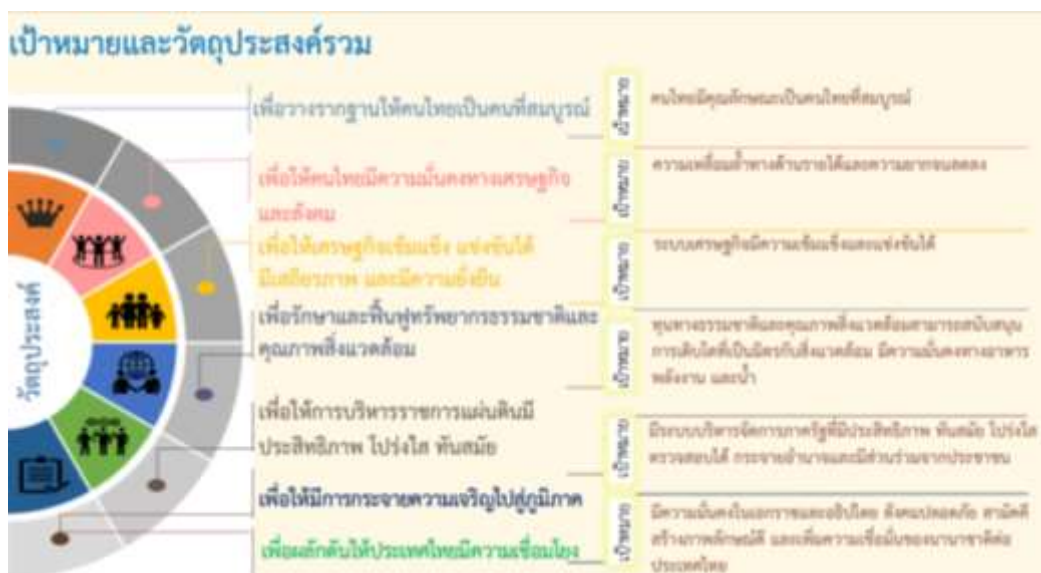
แผนภาพที่ 2 เป้าหมายและวัตถุประสงค์รวมของแผนพัฒนาเศรษฐกิจและสังคม ฉบับที่ 12

7. เพื่อผลักดันให้ประเทศไทยมีความเชื่อมโยง (Connectivity) กับประเทศต่างๆ ทั้งในระดับอนุภูมิภาค ภูมิภาค และนานาชาติได้อย่างสมบูรณ์และมีประสิทธิภาพ รวมทั้งให้ประเทศไทยมีบทบาทนำและสร้างสรรค์ในด้านการค้า การบริการ และการลงทุนภายใต้กรอบความร่วมมือต่างๆ ทั้งในระดับอนุภูมิภาค ภูมิภาค และโลก