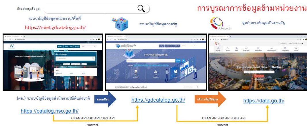
แผนภาพ 1 การทำงานร่วมกันระหว่างระบบบัญชีข้อมูล ภายใต้ Platform Government Data Catalog ที่เป็นมาตรฐานเดียวกัน