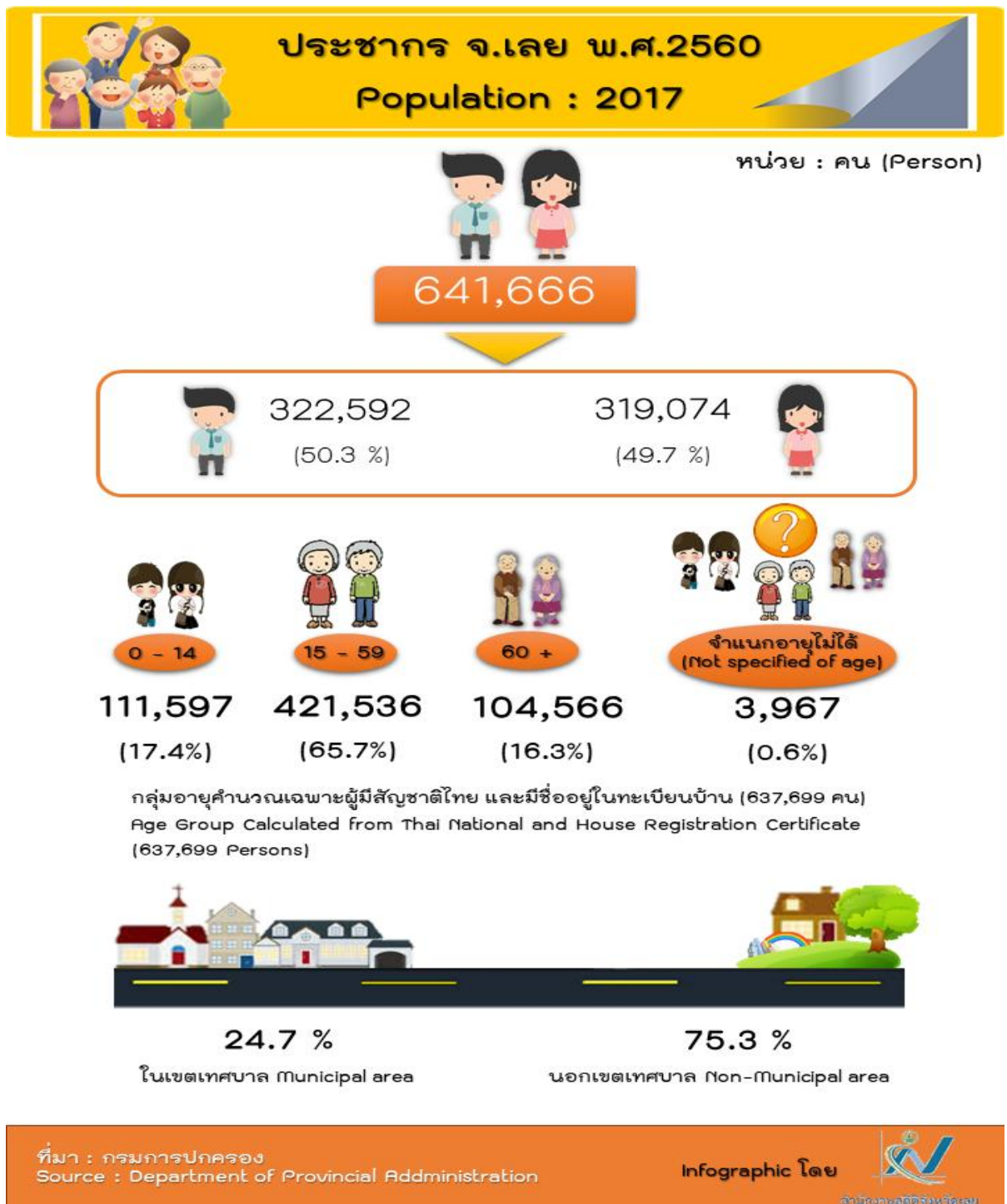
แผนภาพที่ 2 : Infographic ประชากรจังหวัดเลย พ.ศ. 2560