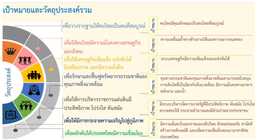
แผนภาพที่ 9 เป้าหมายและวัตถุประสงค์รวมของแผนพัฒนาเศรษฐกิจและสังคม ฉบับที่ 12

บทบาทนำและสร้างสรรค์ในด้านการค้า การบริการ และการลงทุนภายใต้กรอบความร่วมมือต่างๆ ทั้งในระดับ อนุภูมิภาค ภูมิภาค และโลก