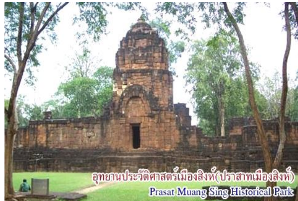
อุทยานประวัติศาสตร์เมืองสิงห์ (ปราสาทเมืองสิงห์) Prasat Muang Sing Historical Park

สุสานทหารสัมพันธมิตร อยู่เยื้องสถานีรถไฟกาญจนบุรี ห่างจากตัวเมืองออกไปประมาณ 1.5 กิโลเมตร เป็นสุสานของเชลยศึกสัมพันธมิตรที่เสียชีวิตในระหว่างสร้างทางรถไฟสายมรณะสมัยสงครามโลกครั้งที่ 2 สุสานนี้จัดสถานที่ไว้สวยงามและเงียบสงบ บรรจุศพทหารเชลยศึก 6,982 หลุม