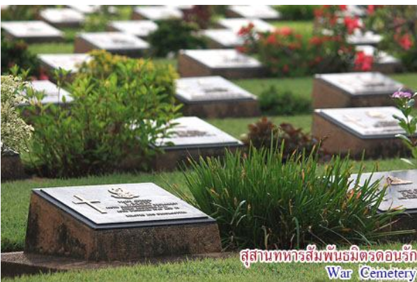
สุสานทหารสัมพันธมิตรดอนรัก War Cemetery

สะพานข้ามแม่น้ำแคว อนุสรณ์สถานที่โด่งดังไปทั่วโลก เป็นส่วนหนึ่งของทางรถไฟสายมรณะ สร้างโดยแรงงานเชลยศึกสัมพันธมิตร โดยการควบคุมของกองทัพญี่ปุ่นในสมัยสงครามโลกครั้งที่ 2 สร้างข้ามแม่น้ำแควใหญ่ที่ตำบลท่ามะขาม ห่างจากตัวเมืองไปทางทิศเหนือตามเส้นทางสาย 323 ประมาณ 4 กิโลเมตร แล้วแยกซ้ายไปอีกประมาณ 870 เมตร และในช่วงปลายเดือนพฤศจิกายนถึงต้นเดือนธันวาคมของทุกปี จะมีการจัดงาน “สัปดาห์สะพานข้ามแม่น้ำแคว” เพื่อรำลึกถึงความสำคัญของการสร้างทางรถไฟสายมรณะและสะพานข้ามแม่น้ำแคว ซึ่งจะมีการแสดง แสง สี เสียง บอกเล่าเรื่องราวทางประวัติศาสตร์ช่วงสงครามโลกครั้งที่ 2 กับระบบแสงเสียงเร้าใจ สวยงามตระการตา ซึ่งจะจัดตรงบริเวณสะพานข้ามแม่น้ำแคว และมีการออกร้านของหน่วยงานราชการและภาคเอกชนอย่างครบครัน